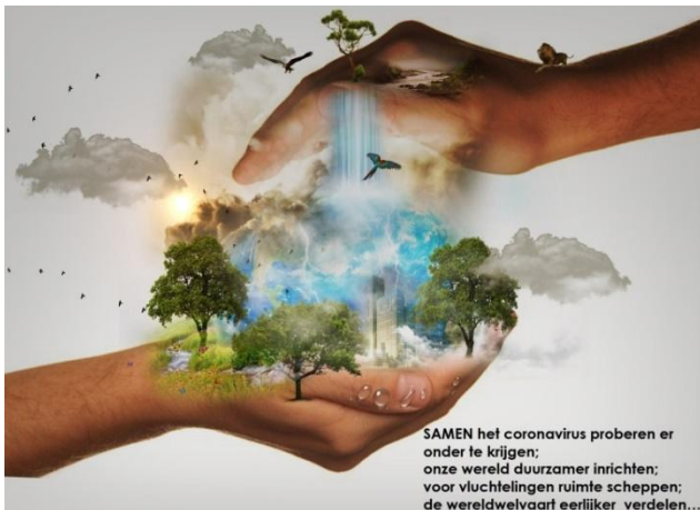
Die Naturschützer (milieubescherming)

Het gekrakeel over coronamaatregelen wekte de indruk dat het nog veel erger is dan ziek en zelfs overlijden, wanneer we beperkt worden in onze vrijheid door maatregelen om onszelf en elkaar tegen die ellende te beschermen. Nou is het in zijn algemeenheid in ons land toch al zo, dat niks zo goed is of het deugt niet. En ook gaat dat altijd met het kleineren van een ander gepaard en schelden met woorden als idioot, imbeciel, randdebiel, zakkenvuller, crimineel.